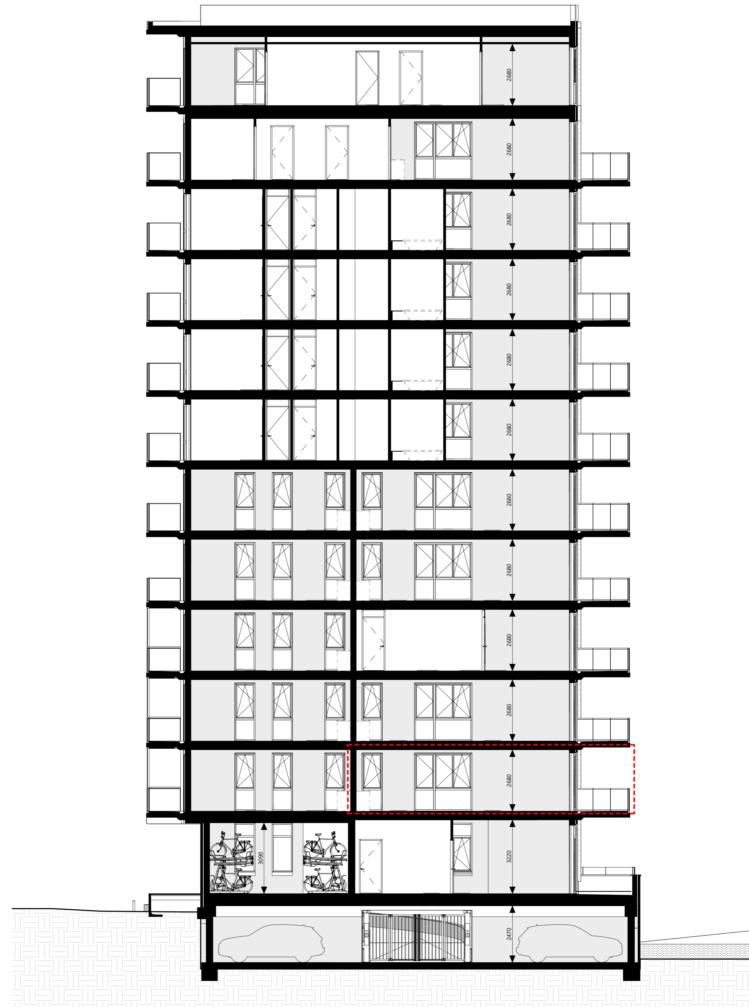
doorsnede A 1 : 100