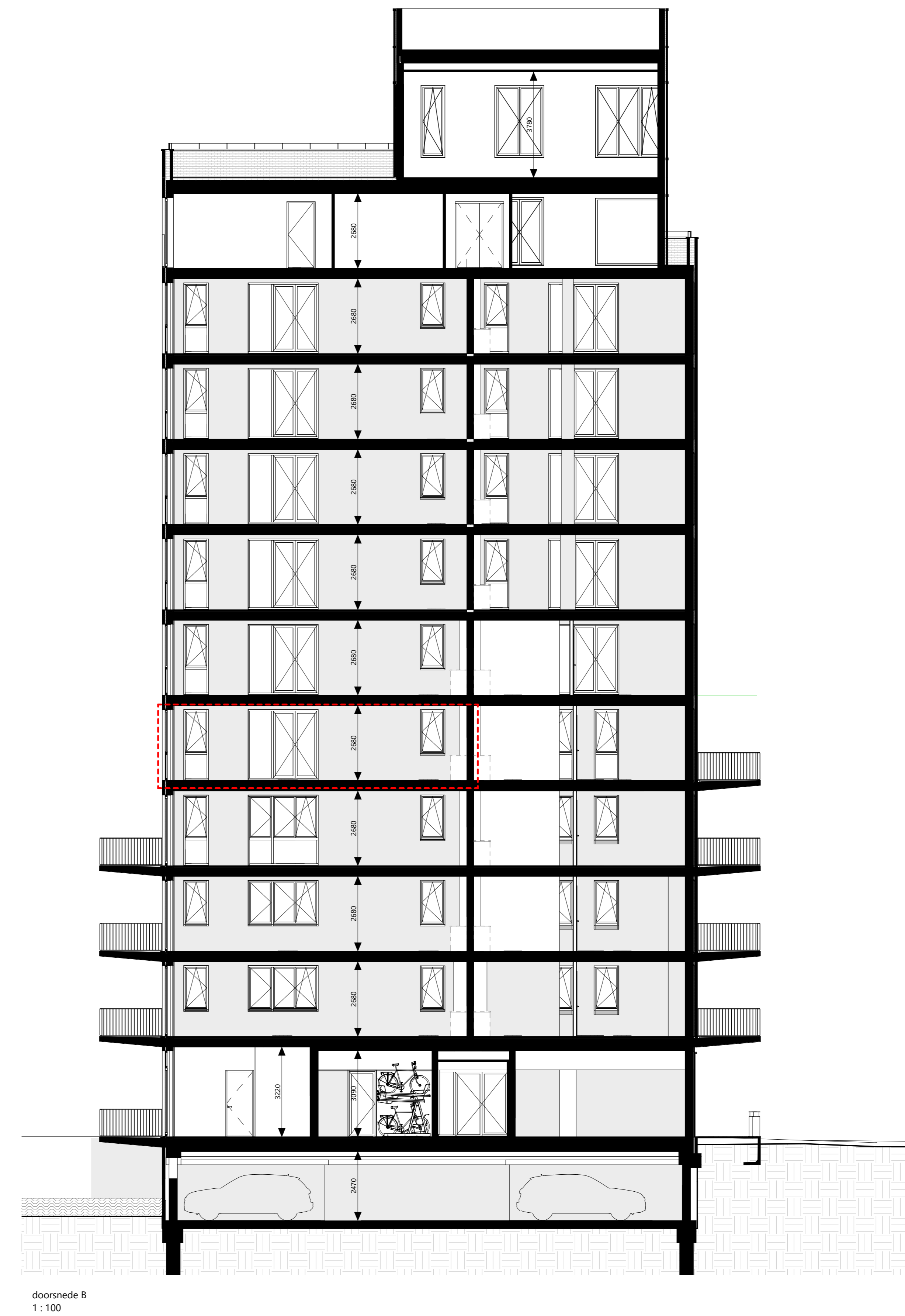
doorsnede B 1:100